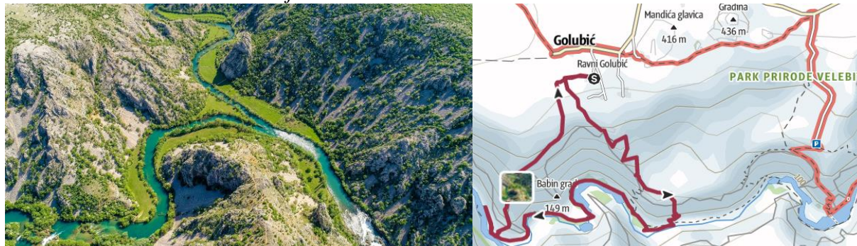
Slika 2. Trail staza “ Od reke i ljubavi – Vratolum ”

Staza “ Od reke i ljubavi – Kudin most ” vodi u dno kanjona Krupe starim kolnim putem. Uz reku preovladava idilično okruženje dok je uspon klasičan kameniti put.