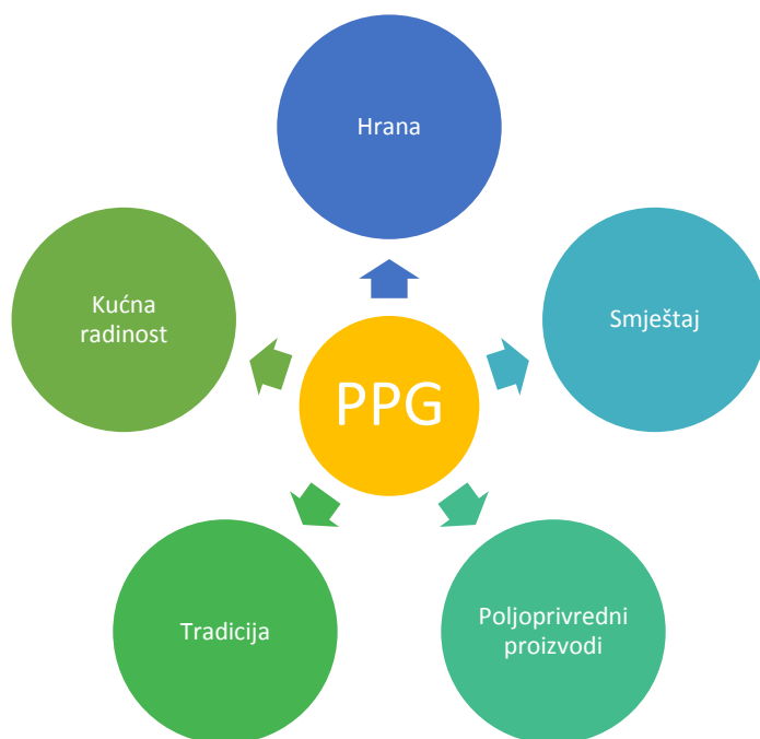
Slika 2. Pravci uključivanja porodičnih poljoprivrednih gazdinstava u pružanje usluga agroturizma

Jedna od kritičnih tačaka u modelu uključivanja porodičnih poljoprivrednih gazdinstava u pružanje turističkih usluga je njihovo povezivanje sa potencijalnim turistima, odnosno načini kako da turisti pronađu ta gazdinstva i dođu do njih. Pored korištenja digitalnih tehnologija i alata za direktnu promociju agroturističkih potencijala (pravac A), posrednici kod dovođenja turista u ruralna područja u zaleđu jadranske obale mogu biti turističke agencije (pravac B) i subjekti koji turistima prodaju druge turističke proizvode, prije svega hoteli i pružaoci usluga privatnog smještaja (pravac C), čija se atraktivnosti povećava kombinovanjem sa agroturizmom. Ovo naročito važi za područje Sjeverne Dalmacije, gdje veliki broj turista tradicionalno dolazi zbog kupanja i drugih sadržaja koje obezbjeđuju morska obala i otoci. Ovdje se javlja potreba uspostavljanja povjerenja i saradnje pružalaca primarne turističke ponude i pružalaca dodatne turističke ponude (povratnička poljoprivredna gazdinstva).